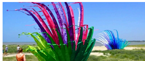
Les 10 et 11 mai de 11 h à 18 h sur la base 217 Tarifs : 5 €/ jour/adulte - 3€/jour/moins de 12 ans - gratuit pour les moins de 5 ans. Billetterie en ligne : www.coeuressonne.fr

Participez à l'événement inédit cerfs-volants ! Un spectacle familial et ouvert à tous qui émerveillera les plus jeunes comme les plus âgés. Pendant deux jours, vous pourrez assister à des démonstrations impressionnantes de cerfs-volants exceptionnels. Certains atteindront près de 30m d'envergure ! Des pilotes professionnels seront aux commandes pour vous faire vibrer. Une exposition mettra en lumière l'histoire et les évolutions techniques de ces objets volants à travers le monde. Les familles et les plus jeunes pourront également participer à des ateliers de fabrication où ils apprendront à concevoir et personnaliser leur propre cerf-volant. Une zone de vol leur sera dédiée pour leurs premiers essais. Gérard Clément, cofondateur du Festival international de Berck-sur-Mer soutient cette première édition dédiée aux cerfs-volants.