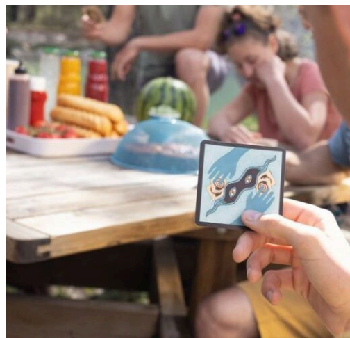
Samedi 17 mai de 15h à 22h, salle polyvalente Entrée libre et gratuite, snack et buvette sur place.

Pour celles et ceux qui préfèrent les jeux rapides, un bar à jeux sera à disposition avec JUNGLE SPEED, TIME'S UP, COYOTE et SKULL, de quoi tester vos réflexes et votre sens de la stratégie. Les amateurs de réflexion ne seront pas en reste avec des parties passionnantes de SEVEN WONDERS, LES COLONS DE CATANE, CHAOS ET LOUP-GAROU, idéales pour défier vos amis et créer des alliances surprenantes. Que vous soyez joueur aguerri ou simple curieux, il y en aura pour tous les goûts ! Rejoignez-nous pour un moment de fun, de rires et de défis mémorables !